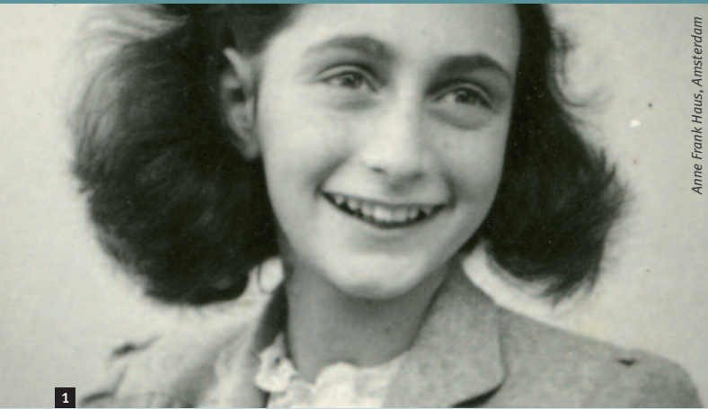
Anne Frank Haus, Amsterdam