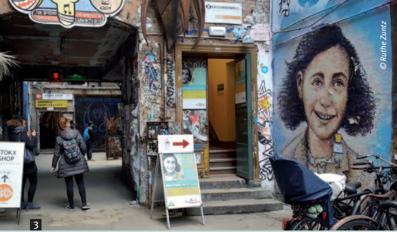
Das Anne Frank Zentrum befindet sich neben den Hackeschen Höfen in Berlin-Mitte. The Anne Frank Zentrum is located right next to the Hackesche Höfe in Berlin-Mitte.